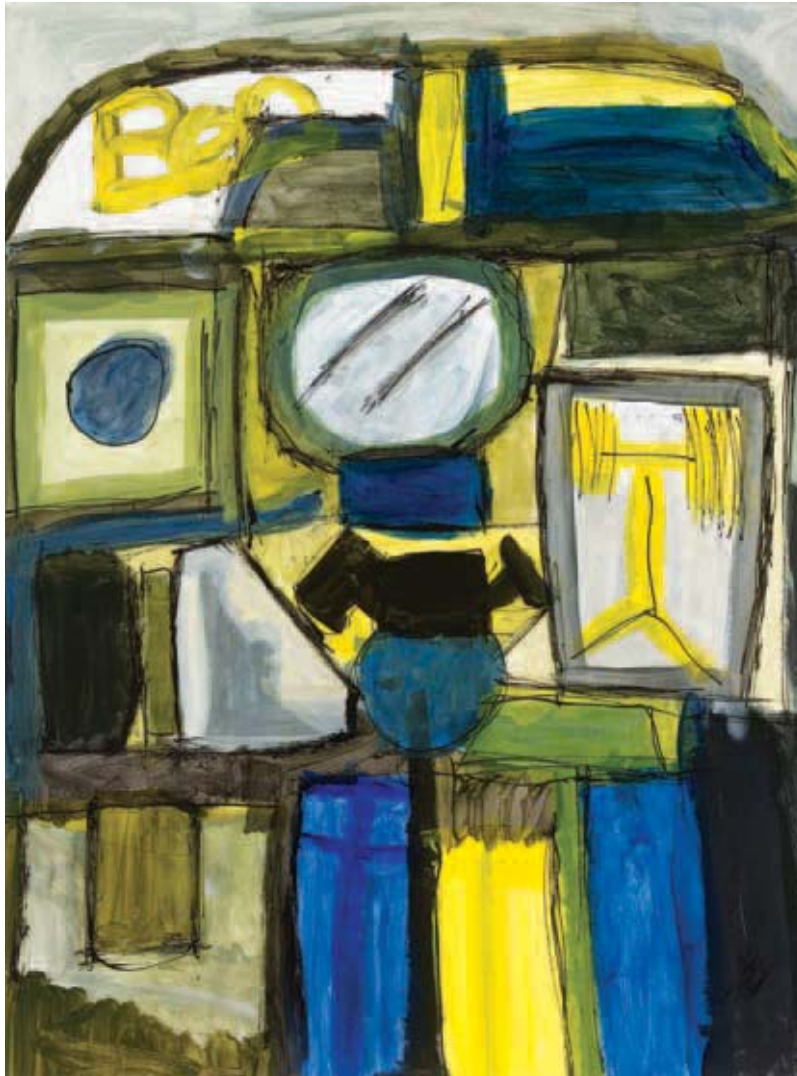
Trommels, Ben Wuisman, 1994, gemengde techniek, 62 x 47 cm

het blauw van de lucht en de zee, het geel van het strand en het groen van de planten en bomen. Met name doordat de kleuren zo helder zijn, roepen ze associaties op met de lente, wanneer het groen nog licht en pril is. Precies die menging van het heldere blauw en het helle geel, die Wuisman gebruikte. Tegelijkertijd sprak het werk me aan omdat het abstract is. In onze kunstuitleen zijn vooral figuratieve werken, ook al is de voorstelling meestal geen kopie van de werkelijkheid. Er zijn wel abstracte werken, maar die zijn niet altijd zo vormvast, het gaat dan meer om werken vol van kleur, zonder stevige vormen. In dit werk zien we duidelijk afgebakende vormen, die diepte hebben. Die diepte wordt verkregen door de wijze waarop de verf op het papier is geschilderd, namelijk met een stevige penseelstreek, waardoor je de verfstreek kunt