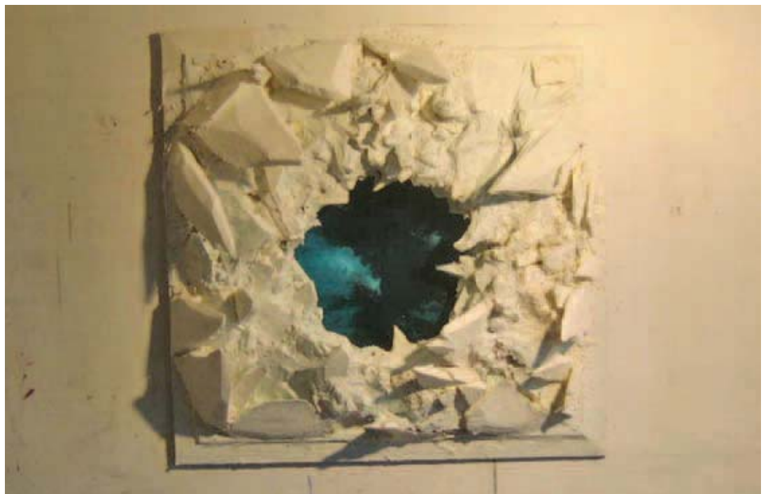
Case (Kees van der Knaap); The Big Hole; polystyreen, polyurethaanschuim, gips, papier, huidenlijm en olieverf op een ondergrond van MDF en chipwood; mei 2007; 120 x 120 cm www.atypicalcase.com