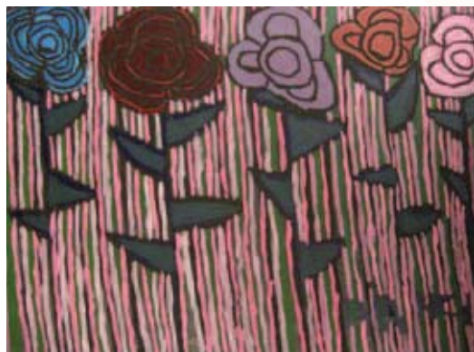
Bianca Venmans, Rozen, acryl op hout (multiplex), 2008

Atelier & Kunstuitleen de Blauwe Roek Museumplein 6 9203 DD Drachten Telefoon: 0512 - 54 90 02 E-mail info@deblauweroek.nl www.deblauweroek.nl