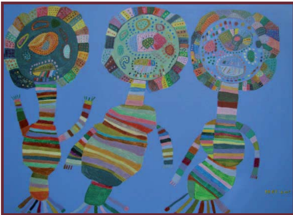
Gert Nout, Theaterstukken, acryl op doek, 100 x 70 cm