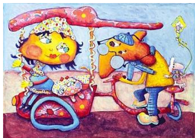
Takky, Bakfiets zullen we samen een ritje maken Olieverf/Acryl op papier, 70 x 90 cm

De organisatie van de Stichting Special Arts bestaat uit een bestuur, de leiding en een 40 tal vrijwilligers.