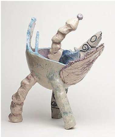
Olga de Bruin, Spanje Keramik, 22 x 33 cm

Stichting Special Arts Nederland (roepnaam Special Arts) is vanaf 2008 de naam van een slagvaardige, flexibele organisatie die is ontstaan door een samengaan van Very Special Arts Nederland, Stichting K4 uit Purmerend en de Stichting Art As Well/Een Hele Kunst uit Amsterdam.