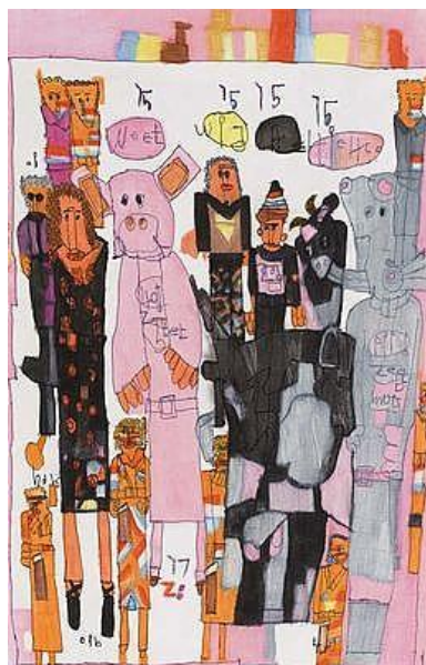
Camille Grootaers, Juffrouw Venken Gemengde techniek op papier, 70 x 60 cm

Via het Kenniscentrum Kunst en Handicap bevordert de stichting voor en met kunstbegeleiders/docenten praktijkgerichte kennis m.b.t. de kwaliteit en kwantiteit van de kunstbeoefening en het kunstenaarschap van mensen met en handicap. De stichting vervult met het kenniscentrum een belangrijke rol in de Nederlandse samenleving.