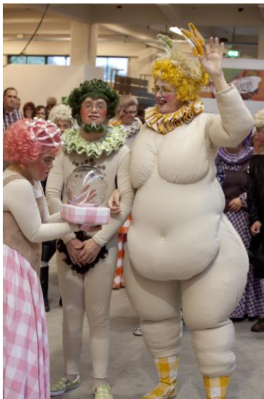
Theater Kamak tijdens de opening van de Art Brut Biennale 2012