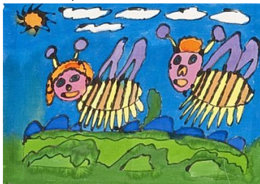
John Siemerink, Bijtjes

Special Arts heeft een grote collectie kunstwerken die zeer geschikt zijn voor kinderkamers of voor ruimtes waar veel kinderen komen , zoals een kinderdagverblijf, een artspraktijk of een consultatiebureau. U vindt de kunst voor kinderen met name in de kunstuitleenruimte. De meeste kunst is te huur en/of te koop.